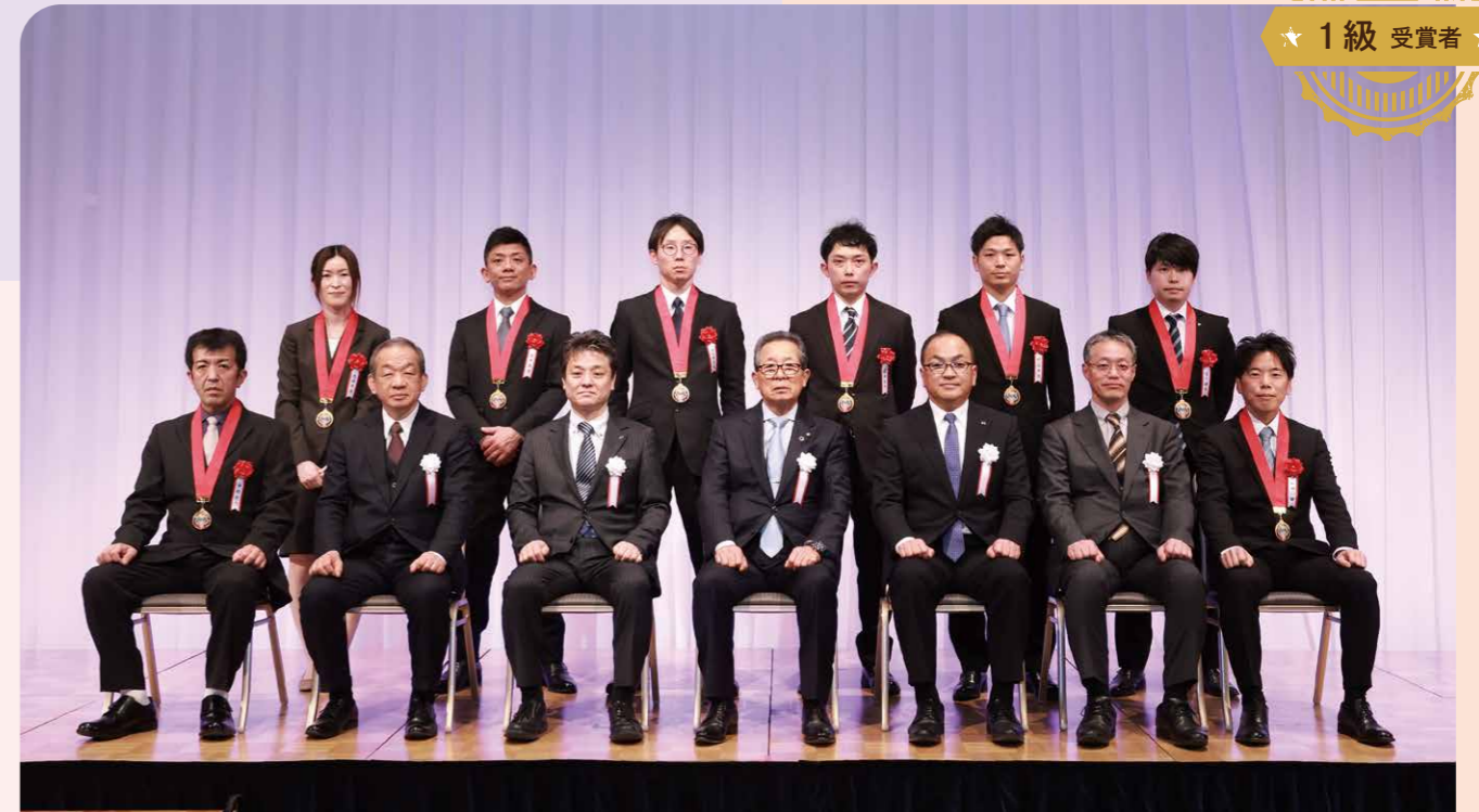
1級の成績優秀者は21人。表彰式のこの日、うち16人が式に出席。

製造現場のオペレーターは自主保全の知識、技術を習得することで、迅速な異常発見や修理・改善ができるようになり、重大な故障を未然に防ぐことができます。