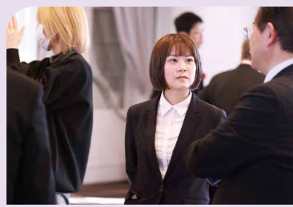
懇親会で懇談する受賞者たち。別の職場の人と意見交換できる有意義な機会に。