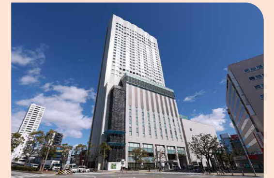
2023年度の表彰式は、名古屋市のANAクラウンプラザホテルグランコート名古屋で開催された。

その後の懇親会は優秀自主保全士同士の貴重な交流の場に。皆さんが言葉を同じくするのは「表彰されて満足するのではなく、ここからがスタート」の一言。2024年も10月に「自主保全士検定試験」が実施されます。自主保全の意識から、製造現場が変わります。