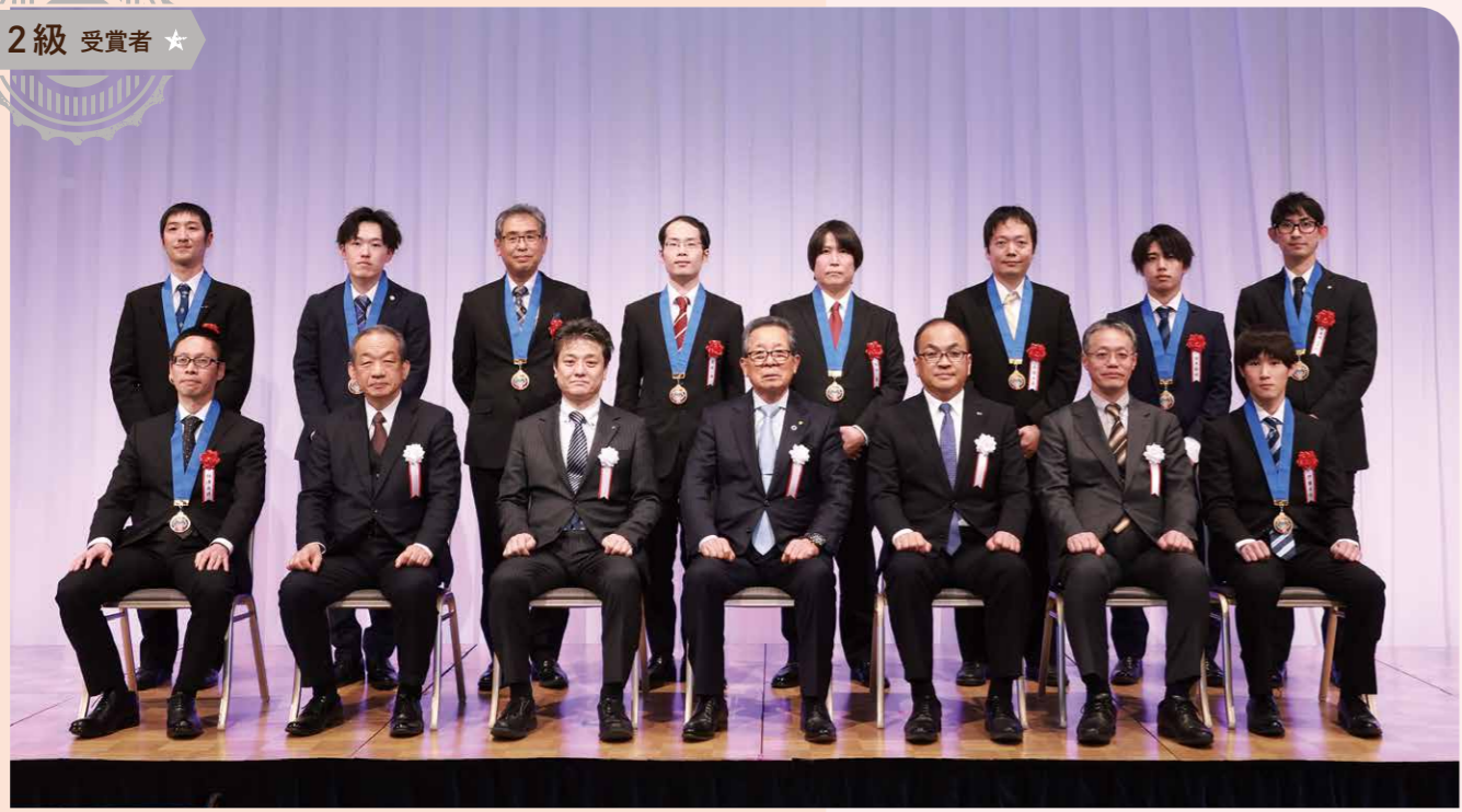
2級の成績優秀者は57人。うち30人が表彰式に出席。会社の研修や上司からのアドバイス、そして家族の応援に支えられたという声も聞かれた。