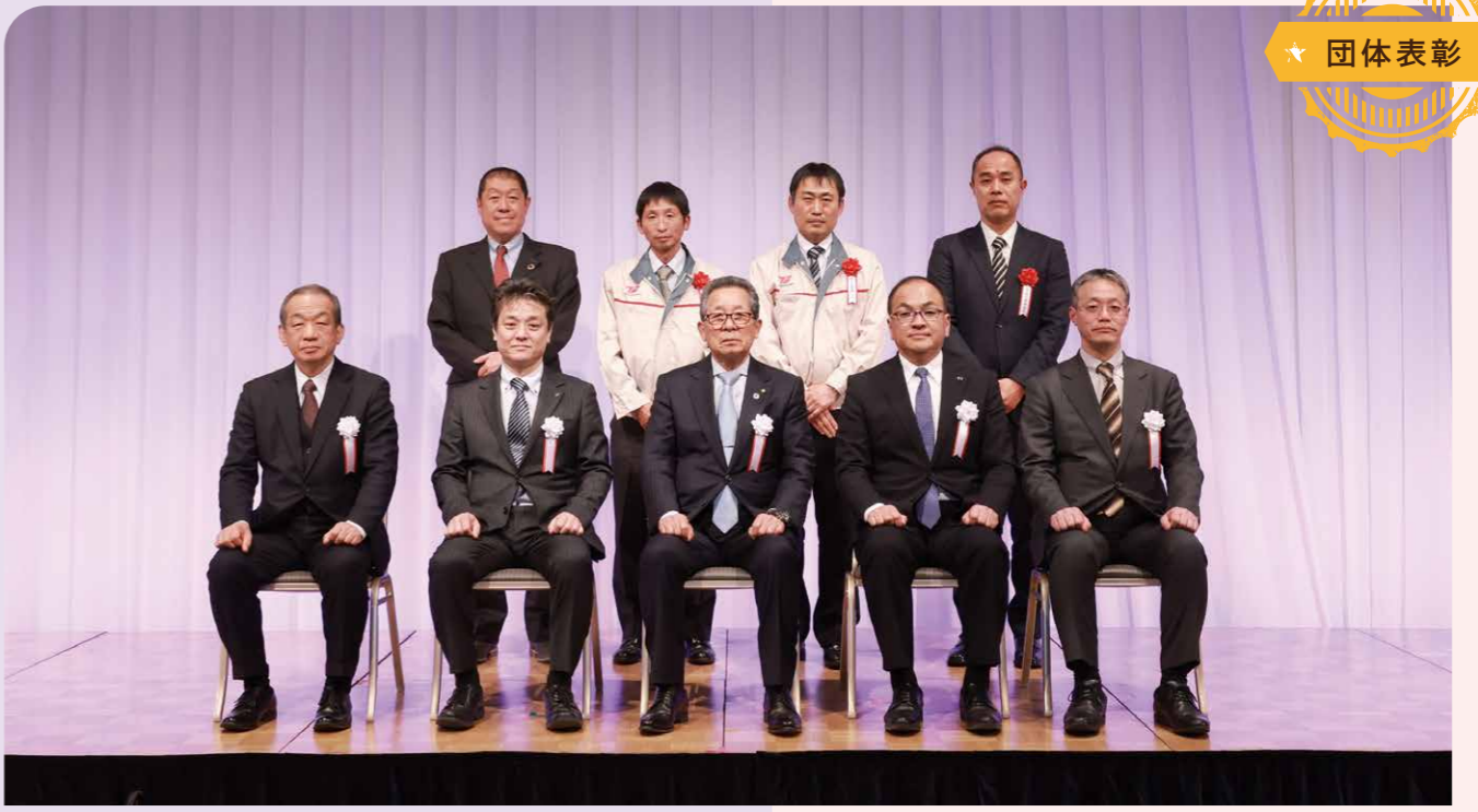
団体表彰では、大日カラー・コンポジット株式会社、大日精化工業株式会社、トヨタ紡織株式会社、日産自動車株式会社が表彰された。同日、大日精化工業株式会社とトヨタ紡織株式会社から講演があった。